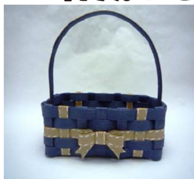
提供:クラフトバンドエコロジー協会